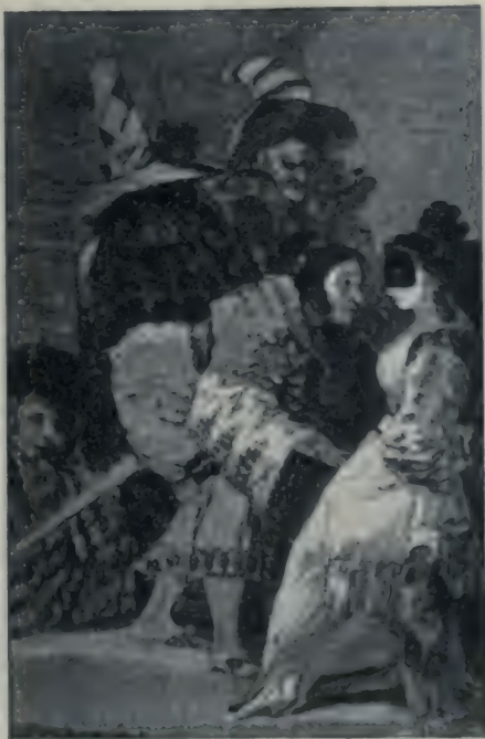
Nadie se conoce.

Sandoz, résumant la situation, écrivait à Berlin : « La reine et Godoy desirent à tout prix la paix pour disposer à leur gré de l'argent public (1). » Cependant, pendant le procès de Louis XVI, Charles IV qui avait, au lendemain du 10 août, offert l'hospitalité à la famille royale, fit mettre à la disposition d'Ocariz les sommes que celui-ci jugeait nécessaires pour gagner des voix à la Convention (2). Ocariz se laissa bernier par le conventionnel Chabot qui lui escroqua, dit-on, 1 800 000 livres et ne livra rien en échange (3). Pendant ce temps, les